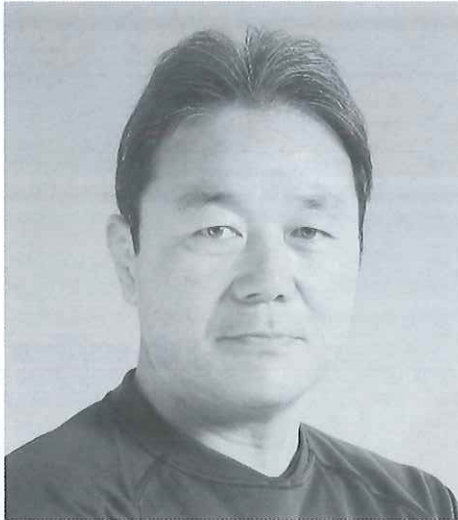
きよみや かつゆき 清宮 克幸 さん